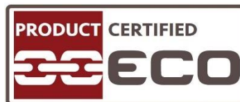
Figura 3 – Marchio ECO per Organizzazioni con prodotto certificato

Il font utilizzato è corpo 8, grassetto.