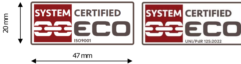
Figura 1 – Marchio ECO per Organizzazioni con Sistema di Gestione certificato secondo la norma ISO 9001